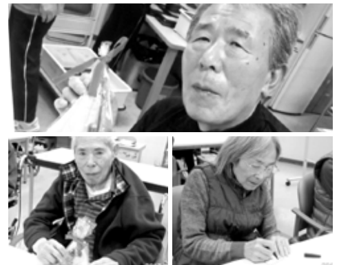
※顔写真は、了解を得て掲載させていただいております。

12月4日ほほえみ呉デイケアでは一足早いお正月飾り作りを行いました。まずは飾り選びから!!「どれにしよ～」「あっこれかわいいね」と話しながら決められていました。一人ひとりが選ばれた、南天や松ぼっくり。皆様、真剣にほうきに飾っておられました。最後にリボンをつけて完成!!一つひとつ個性があって、とても素敵な作品が出来ました。また「かわいくできた!!」「どこに飾ろうかしら?」と皆様、完成の達成感を感じながら喜んでくださいました。