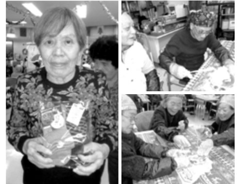
※顔写真は、了解を得て掲載させていただいております。

12月になると外はイルミネーションに彩られ、町はクリスマス一色に飾られている中、ほほえみデイサービス5Fでは、クリスマス会を行いました。午前中は、ご利用者様と一緒に手作りのクリスマスケーキを作ってみました。「手作りなんかやったことがないわ」「いつも買う事が多いわ」と、初めて手作りケーキに挑戦する方が、ほとんどでイチゴを切ったリスポンジに生クリームを塗ったりデコレーションしたり、とても初めてとは思えないくらい手際が良く「これお店で売れるかもよ～」と冗談も出るくらい楽しく作ることが出来ました。午後からは、クリスマスプレゼントを兼ねてビンゴゲームを行いました。ご自分の品物欲しさに、数字を見ながら真剣に合わせていました。ビンゴになると普段よりも大きな声で「ビンゴ!!」と嬉しそうに品物を選んでいく姿はまるで重心に帰ったようでした。最後にピアノの上手な、ご利用者様によるピアノ伴奏で「きよしこの夜」を皆様で歌い、手作りのケーキを食べ、とても楽しい1日を過ごすことが出来ました。