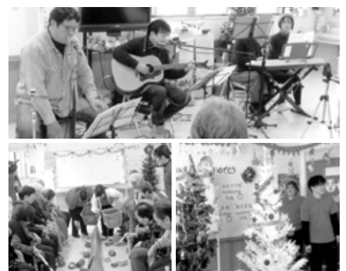
※顔写真は、了解を得て掲載させていただいております。

12月9日(土)ほほえみ呉東では「クリスマス会」を行いました。午前中は、ゲームとツリーの飾り付けです。ゲームの「山越えゲーム」では、クリスマスカラーの赤、緑、黄の紙筒を2チームに別れて向かい合わせに並び、棒ですくいあげ、山を越えて相手チームにたくさん入れた方が勝ちです。皆様、必死になり、なかなかの接戦で終了の笛を鳴らしても、なかなか止められず大いに盛り上がりました。クリスマスツリーの飾り付けは、二手に別れて緑と白のツリーを各々台車にくくりつけ、端から動かしクリスマスソングをバックに色とりどりのオーナメントを、各自バランスを考えながら飾り付けました。最後は電飾を取り付け皆で「5・4・3・2・1」とカウントダウンして一斉に点灯!!飾り付けられたツリーがライトに照らされ、とてもきらびやかで、「ワーきれい」と歓声が沸きました。午後からは、慰問で『呉フォーク村』の皆様をお迎えました。声量のある歌声で、なつかしい歌の数々を演奏し歌っていただきました。皆様コンサートのような演奏に感動し、思わず身体を乗り出されたり立ち上がりたり、力いっぱい手拍子され大変喜ばれ、とても充実した楽しい行事となりました。