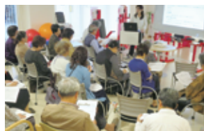
講演会・セミナー