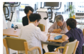
勉強会・脳トレ教室