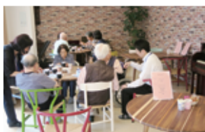
医療・介護 何でも相談会