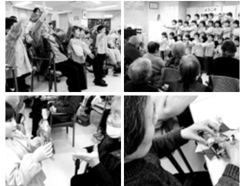
※顔写真は、了解を得て掲載させていただいております。

最近はや暖差が激しく体調管理も大変ですが、今のところご利用者様は殆どの方が風邪も引かず通所して下さっていることに感謝しつつ、今月も楽しい行事を準備させていただきました。午前にはひな飾りを自宅に飾っていただくということで壁掛けを各自で作っていただきましたが、難しい部分はスタッフがお手伝いしながら、何とか完成させることができました。午後からは、警固屋みらい保育園の園児達28名が慰問に来てくださり歌を披露。ご利用者様を拝見すると、皆様眉をハの字にして優しい表情で頷きながら聴いておられました。そのあとで、ご利用者様と園児達で豆まきを行い、赤兎・青兎の登場に固まる園児もいましたが、おみやげを渡すと表情も一変!!楽しい時間はあっという間に過ぎ、最後にご利用者様がお礼の言葉を伝えようとしたのですが、途中、何度も涙で声を詰まらせ周囲の人達ももらい泣き…。「又、来るね～!」「又、来てね～!」と全員でゆびきりをして別れを惜しみました。子供達との交流は、ご利用者様にとってすぐ良いストレス発散・気分転換に繋がったと思います。