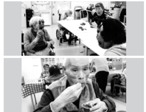
※顔写真は、了解を得て掲載させていただいております。

2月に入り、皆様も鬼退治やってますか?こちらでも、豆まきにみたてた鬼退治。ときどき鬼が反撃してきたり、鬼が増殖してみたりと、今年の鬼はやたら手ごわかったですが、無事に鬼をやっつけることができました。2月といえば、バレンタインデー。なのでチョコレートのスイーツをご賞味。食べたあとの顔がまさに福の神です。ああ、鬼じゃなくて人間に生まれてきてよかったですね。