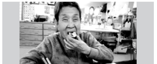
※顔写真は、了解を得て掲載させていただいております。