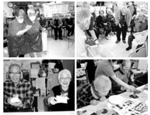
※顔写真は、了解を得て掲載させていただいております。

立春が過ぎ季節の変わり目である節分に豆を鬼に投げて邪気を払い一年の無病息災を願いますが、6階では2月12日(水) 兎ヶ島を舞台にして皆様が鬼になり邪気も吹き飛ばす元気で、障害物リレー競争を行いました。1チーム職員とご利用者様の5人組で、日頃のリハビリ運動を活かして階段昇降、平行棒から足に負荷をかけての歩行移動、ボール投げ、職員と一緒に鬼のパンツをはいて二人三脚でゴールを目指します。鬼のお面をバトン代わりにして4チームで競い合い赤鬼チームが優勝しました。午後は傘地藏と傘だるまの、どちらか好きな方を選択して作りました。イスの靴下に綿を入れて傘などの飾りを付けていきます。ビーズで地藏は念珠を、だるまは首飾りを作り台座に固定して顔を書いたらできあがり。表情により個性が出て自分だけの置き飾りが完成し、お地藏さんの様に皆様の顔もにっこりとほほ笑んでおられました。最後に今年も一年間元気に過ごせる様に自分の年を書いて作った旗をおやつにさし、食べて締めくくりました。