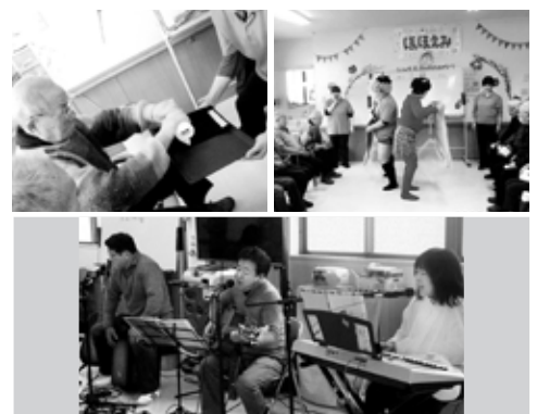
※顔写真は、了解を得て掲載させていただいております。

2月8日(土)、ほほえみ呉東では行事「節分会」を行いました。午前中には、フェルトで作った恵方巻をご利用者様に巻いていただき、チームで早さを競うゲームを行いました。ゆっくり丁寧に巻かれる方や、早さを重視しフェルトがはみ出している方など、その方なりの恵方巻が出来上がりました。次にペットボトルと割り箸で作ったおみくじをご利用者様に引いて貰い、運試しをしていただきました。大吉が出た方は「やったー」と喜ばれ、凶が出た方は「あーあ」と残念そうな顔をされていました。最後にスタッフが鬼になって登場し、玉入れを行いました。その後、玉を豆に見立て鬼に玉を投げ鬼退治を行うと「鬼は外」と叫びながらご利用者様は楽しそうに笑われていました。午後からは慰問「呉フォーク村」の方々に色々な歌を歌っていただきました。フォークソングや「北国の春」などの歌謡曲メロデー等、聴き馴染みのある歌を沢山歌っていただき、手拍子をされている方や、歌詞を口ずさんでいる方など思い思いに鑑賞されていました。最後にはカープの歌を皆で歌い、「優勝間違いなし」と大盛り上がりで終了しました。1日を通して季節を感じながら楽しんでいただき、とても有意義な行事「節分会」となりました。