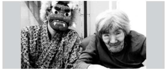
※顔写真は、了解を得て掲載させていただいております。