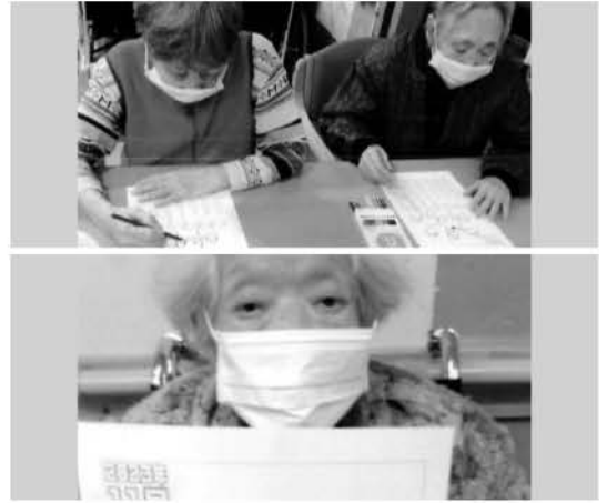
※顔写真は、了解を得て掲載させていただいております。

立冬を迎え、野呂山には初雪も降ったそうです。冬布団や暖房、加湿器のシーズンになりました。「11月3日は文化の日だったので、曆に色を塗ってみませんか?」と、皆様に11月の曆をお配りしました。図柄をご覧になって「ああ、リスとドングリなんじゃね。リスも冬支度で、ドングリを集めるんじゃないか」「文化の日と言えば、子どもらが学校行きよる頃は、催し物があって、わたしらも見に行っただもんよ」「バザーに出す物、家から持って行ったわ」「うちの子は、クラスでクッキーと紅茶出すけん金券買って言うて」「あった、あった。おもしろかったよねえ」と懐かしそうに想い出話をされながら、はみ出さないようにキッチリ色鉛筆を動かしておられました。それにしても、あんなに「あつい、あつい」と思っていたのにもう11月。月日のたつのは早いものです。もう秋の虫の音も、いつの間にやら聴こえなくなっていますね。