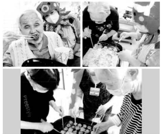
※顔写真は、了解を得て掲載させていただいております。

いつになったら外出や外食できるようになるのだろうと思いつつ今月はたこ焼きを焼いてみました。たこ焼きの焼ける様子やソースの匂いは懐かしい昔を思い出されるのか、皆様興味深々でホットプレートに目が釘づけです。やけどが心配なので初めは職員が全て焼こうと思っていましたが、余りの熱視線につい「焼いてみますか?」。すると私たちより手際よく上手にたこ焼きを焼いてくださいました。出来立ての熱々のたこ焼きを、はふはふしながら食べました。美味しかったですね。また作ろう!次はベビーカステラをコロコロしてみませんか?寒くなってくるのでお鍋パーティーもいいですね!皆様には食べる楽しみや自分で食べられる喜びを長く味わってほしいと思っています。