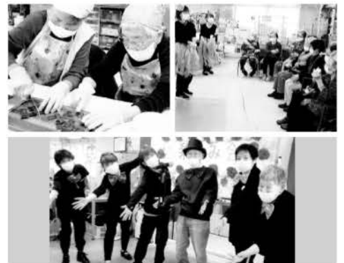
※顔写真は、了解を得て掲載させていただいております。

11月13日(月)、デイサービス6Fでは「お楽しみ会!」を行いました。午前中は、おやつチョコバナナプリン作りです。バナナを潰す人、チョコを刻む人、溶かす人など各担当に分かれての作業です。「美味しくなあれ」と願っての作業、おやつ時間が楽しみの様子です。皆様エプロン、三角巾お似合いですヨ!午後からは、かくし芸大会です。今チマタで話題の『ブギウギ』ほほえみオリジナル体操で開幕。職員による銭太鼓・安来節・テーブルクロス引き・ハンドベルなどなど…そして大トリは男性ご利用者様とスタッフの、クールファイブならめクールシックスで「長崎は今日も雨だった」を熱唱。おなじみコーラス部分の「わあわあわあワァ〜♪」で大盛り上がりで幕が降りました。ご利用者の皆様にとっても喜んでいただけただけでした。おやつチョコバナナプリンも「美味しいね!」と笑顔いっぱい楽しい1日になりました。