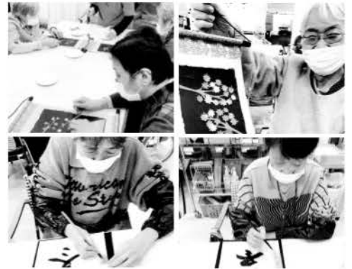
※顔写真は、了解を得て掲載させていただいております。

今月の行事は文化祭と題し、紅葉を散りばめたタペストリー作りや書道に挑戦していただきました。小さな紅葉がなかなか手に取りにくく、貼っていく作業に四苦八苦していましたが何とか完成させることができました。午後からの書道も、皆様筆を持つまでは「字を書くのは苦手!」とか「暫く書くことがなかったから書けるかしら…?」等々、とても不安そうでしたが上手く書けなくても大丈夫!挑戦することに意義があります!!の一声で火がついた様子。集中して取り組み、出来ばえは予想以上の作品が多くて逆に私達が驚かされてしまいました。今回の行事は苦手なことにチャレンジしていただいたのですが、終わってみれば苦手なことでもやればまだまだできるのだという前向きさと、意欲向上に繋げることができたのではないのでしょうか。