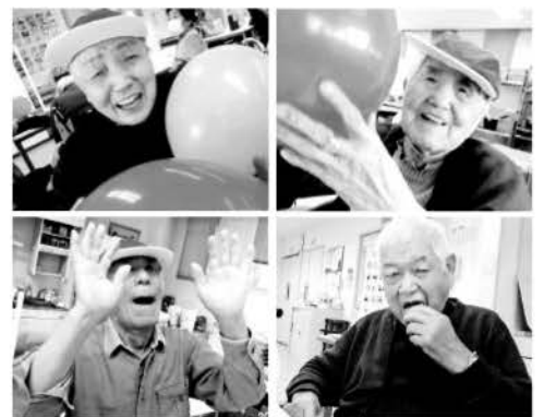
※顔写真は、了解を得て掲載させていただいております。

呉デイケアでは、11月のお楽しみ会を行いました。午前中は「かくれたことばをさがしてみよう」で頭の体操です。午後からは「風船バレー」でしっかりと運動していただきました。おやつは広島銘菓もみじまんじゅうです。皆様、今日イチの笑顔でほおぼっていました。〇〇の秋は、食欲の秋で決まりですネ。笑顔いっぱいの楽しい一日となりました。朝晩寒くなってきましたので、皆様体調には十分お気をつけください。