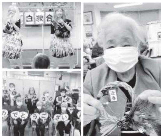
※顔写真は、了解を得て掲載させていただいております。

今月の12月15日ではほほえみは創業30周年を迎えたことご利用者様に感謝の気持ちを伝えたと、今月の行事をスタートいたしました。今月はほほえみ忘年会と題し、午前中はしめ縄作り挑戦です…とは言え、土台のしめ縄に扇や松・水引きなどの飾りを貼っていただく、いつもよりは簡単な作業でしたが、完成品を手に持ち「かわいいのができた〜」「どこに飾ろうかな」と嬉しそうなお表情を見せてくれました。午後からは毎年恒例の紅白歌合戦です!!今年はお利用者様対スタッフで紅白に分かれましたが、さすがご利用者様は日頃からカラオケで鍛えているため緊張することもなく着物に衣裳チェンジし堂々と歌い上げて下さいました。スタッフも負けまいと恥を捨て、変顔の化粧とビニール袋で作った衣裳で大ハッスル!ご利用者様は大喜びで涙を流し大爆笑でしたが、結果は満場一致で引き分けとなりました。今年最後の行事を笑顔、笑顔で終えることができ嬉しく思っています。これからもご利用者様がずっと笑顔(ほほえみ)を持ち続けられるよう、私達スタッフは一丸となって頑張ります♡