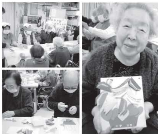
※顔写真は、了解を得て掲載させていただいております。

12月12日に「お楽しみ会」を行いました。午前中は師走を飾る「シクラメン作り」をしました。ピンク・赤・紫の色紙で作った花や植木鉢の茎を「どこにしよう」と悩みながら色紙に貼ってもらいオリジナルなシクラメンの飾りができあがり喜んでおられました。午後は12月に入り寒さを感じる季節になり温泉気分を味わってもらいたく「タオル積みゲーム」をしました。2人ペアでタオルを「たたむ人」「頭にのせる人」になり1枚ずつ落とさずにタオルを頭に積んでもらいました。頭を突き出したり2人で工夫をしながら、うまくいかなくて落ちたりしましたが何とか上手に積み重ねることができていました。最後は10枚のタオルを10人が1枚ずつ頭に積み上げる事に成功し全員で拍手をして終わりました。おやつは「チョコレートケーキ」をおいしく食べて12月も笑顔いっぱいにお過ごせました。