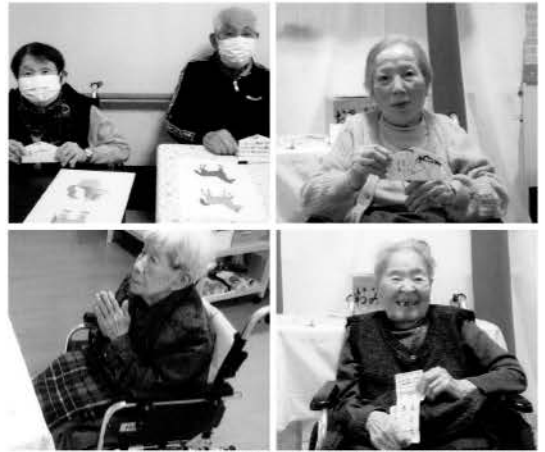
※顔写真は、了解を得て掲載させていただいております。

ほほえみ広国際通りでは、1月11日(日)に絵馬作りとおみくじ引きをしました。まずは絵馬に今年の願い事を書いていただきました。皆様「何を書こうかね」と真剣な表情で思いおもいに願いを込めて書かれ、なかには今年の干支の午をサラッと描かれる方も。出来た絵馬はほほえみ神社に奉納したあとは絵馬掛けに吊るし、フロアに飾りました。おみくじでは大吉を引かれ満面の笑みで拍手をされ「ええ年になるわ」と喜ばれていました。素敵な願いが込められた絵馬がたくさん完成し皆様の笑顔があふれるおみくじタイムとなりました。皆様の願いが叶い、幸せな1年になりますように。