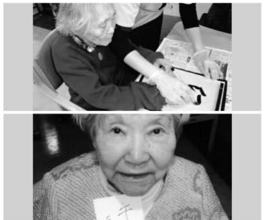
※顔写真は、了解を得て掲載させていただいております。

新年明けましておめでとう御座います。1月ほほえみ呉中央では、新年会として毎年恒例の書き初めを行いました。最初に今年の干支が馬(午)である事を伝え、新年今年のやりたい事、(行きたいところ、食べたい物、好きな言葉等)自分で考えていただき自由に書いていただきました。上手く書けないと言われるご利用者様には、書き初めの書きたい事を会話を交えスタッフが代筆、二人三脚で書き初めを行いました。また、お正月気分を味わっていただくためにおせち料理、七草粥、おしるこなどを提供。今年も存分にお正月気分を味わっていただけたと思います。