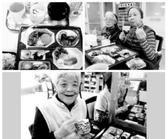
※顔写真は、了解を得て掲載させていただいております。

ほほえみ呉安浦では、1月1日に「新年食事会」を開きました。新年を迎えご利用者様のご健康とご多幸を願い、皆様でお正月料理を囲みました。お刺み、えび、ちらし寿司に目を輝かせ「どれから食べようか」と迷われる方、無言で黙々と食べられる方とそれぞれでしたが、皆様色とりどりに飾られたお料理を前に自然と笑顔になっておられました。皆様が今年もお元気で穏やかにお過ごしいただけますよう、ほほえみ呉安浦スタッフ一同精進してまいります。