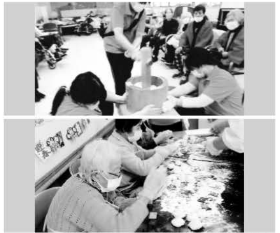
※顔写真は、了解を得て掲載させていただいております。

ほほえみ呉東では1月10日(土)行事「新年会」を行いました。毎年恒例のお餅つきです。ご利用者の皆様にハッピーを着ていただき、1人ずつポーズをとって写真を撮りながら、杵でお餅をついていきます。皆様それぞれの表情があり、普段は見られないような顔を見ることができて、とても盛り上がりました。午後のおやつには、職員特製の善哉を皆で食べて、お正月気分満喫の良一日となりました。