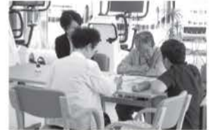
勉強会・脳トレ教室