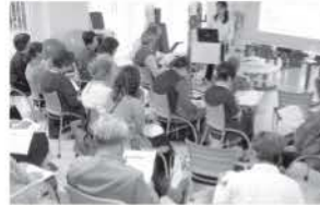
講演会・セミナー