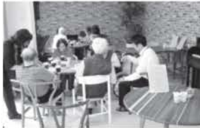
医療・介護 何でも相談会