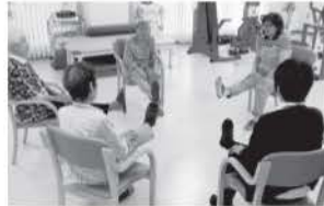
リハビリ・筋トレ教室